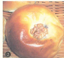
2. これがあんこ4倍あんぱん! 大きくて重いです。