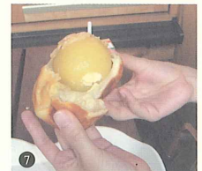
7. りんごちゃんまるまる1個。すご～い。