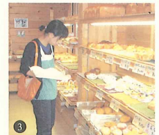
3. 今日はどれにしようかな?