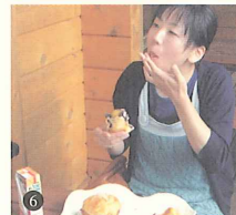
6. とってもおいしい～。