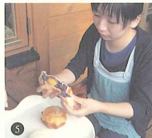
5. 見て見て、栗の甘露煮とあんこたっぷりのあんぱんです。