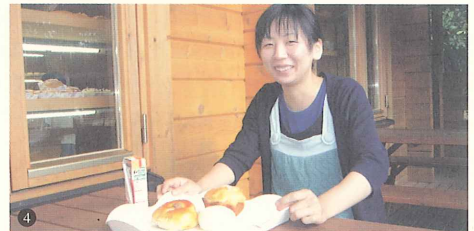
4. パン3点とジュースを買ってデッキでいただきます。