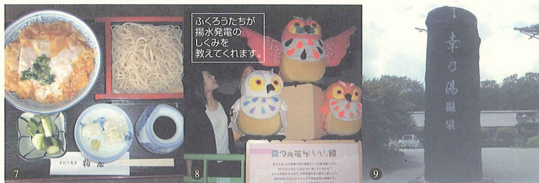
7. 「カツ丼と小せいろそば」のセットです。