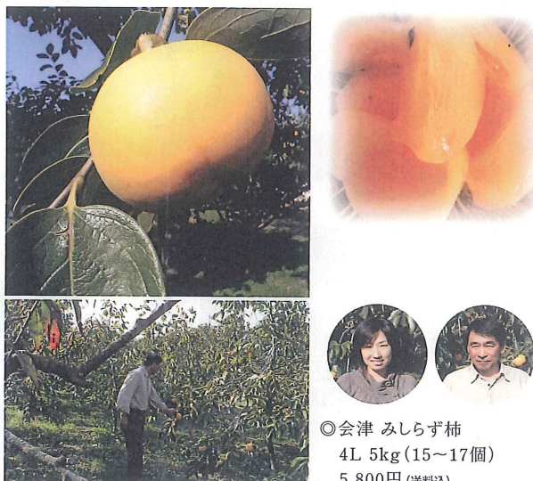
◎会津みしらず柿 4L 5kg(15~17個) 5,800円(送料込)

身のほども知らずにたわわに実を生らせ、枝を折ってしまうことからこの名がついたと言われています。別名、献上柿としても知られています。大きいサイズをご用意。