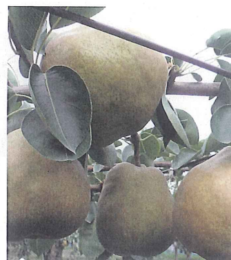
◎らふらんす 約3kg 2,700円(送料込) ※限定品のため化粧箱はありません。

ラフランスといえば山形が本場ですが、那須の隣町、芭蕉の里黒羽にも素朴なラフランスがあります。高貴な香りと上品な味わいをご堪能ください。