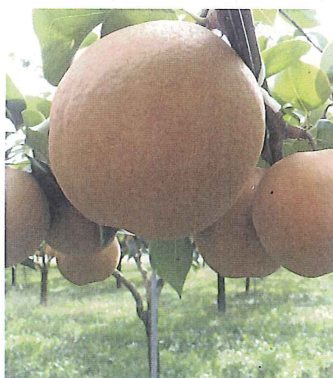
◎にっこり梨 2個入り 2,850円(送料込)

栃木県で生まれた珍しい品種です。幸水の2~3倍大きく、日持ちが良いのが特徴。その中でも特に大きいサイズをお届けします。