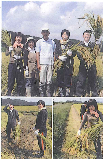
◎尚仁沢こしひかり 5kg 4,200円(送料込)

もうおなじみとなりました尚仁沢湧水を使ったお米、尚仁沢こしひかり。新米をお届けします。今回は、山水閣スタッフも稲刈りに参加させていただき、食物の大切さを肌で感じてまいりました。大地の恵みをぜひご賞味くださいませ。