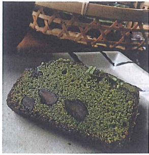
黒豆抹茶パウンドケーキ 1本 1,380円

好評いただいております、オリジナルパウンドケーキが大きくなって新登場。 ご家庭や職場、お友達同士のティータイムにどうぞ。