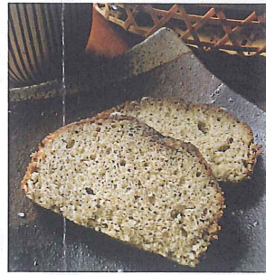
紅茶パウンドケーキ 1本 1,280円

黒豆の甘さと抹茶のながみが溶け合う 大人の味。国産食材使用なので安心安全。 牛乳は地元那須産です。