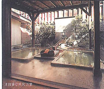
本館貸切風呂 刃室