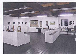
ギャラリーバーン 館内 入場無料 気軽に立ち寄れる