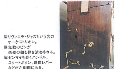
④ リヴィエラ・ジャズという名の オーケストリオン。 ⑤ 無数のピンが 楽器の軸を弾き演奏される。 ⑥ ゼンマイを巻くハンドル、 スタートボタン、選曲レバー などが左側面にある。