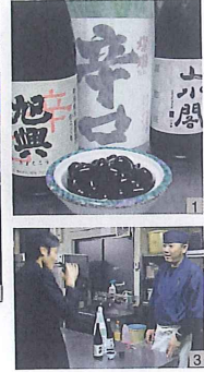
1 純米、吟醸、様々な種類の酒と合わせてみます。 2 1本1本慎重に吟醸妥協はありません。 3 二人によりややく笑顔、実に試飲12本目にたどり着きました。