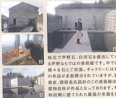
1 はじめての石の美術館。 2 化石に興味津々。 3 建物ごとに様々な展示がある。早速次へ。 4 昭和初期の米蔵に向かいます。

物産センター 8:30～17:00 食堂「水車館」11:00～16:00 鴨そばすいとん 700円 鴨南蛮かけそば 1,100円 定休日 1月1日～1月3日