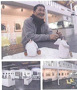
ギャラリーバーン 館内 入場無料 気軽に立ち寄れます