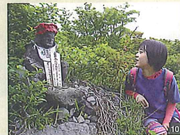
蛇の石像。なんでこの角度で見てるの？