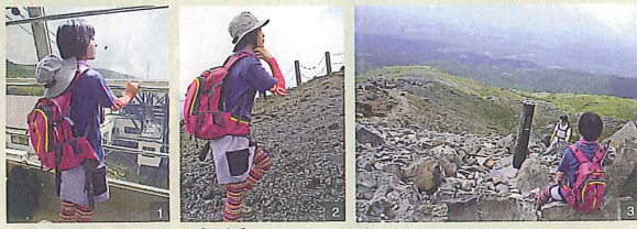
ロープウェイで8回目まで。