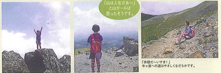
山頂の中でも一番高いところに登る。ほんとの頂点。(1,918mくらい、たぶん。)

●今回の山ガールファッションはコーディネートも含め、「ログスショップ那須ガーデンアウトレット店」にご協賛いただきました。