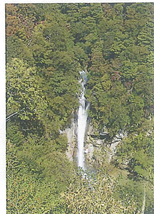
迫力満点、駒止の滝。