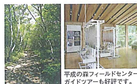
平成の森 フィールドセンターから駒止の滝への気持ちいい散策路。

私たちがまだ詳しくはわかっておりませんがビジターセンターでは、日光国立公園那須甲子地域の自然、歴史、文化を紹介するそうです。国内最大級のセンターで、場所は当館からお車で約10分、殺生石、鹿の湯の少し上に位置しております。