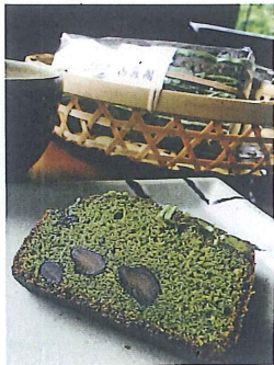
黒豆抹茶パウンドケーキ 1,280円

黒豆の甘さと抹茶のがみの 絶妙なハーモニー。 国産素材で安心安全。 牛乳は地元那須産を使用しています。