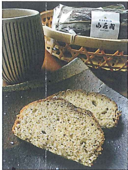
紅茶パウンドケーキ 980円

黒豆の甘さと抹茶のがみの 絶妙なハーモニー。 国産素材で安心安全。 牛乳は地元那須産を使用しています。