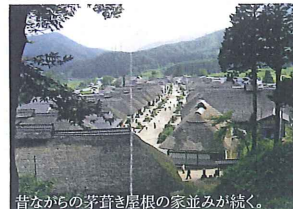
昔ながらの茅葺き屋根の家並みが続く。