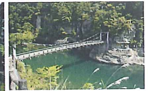
百万年もの長い年月をかけて、侵食と風化を繰り返してきた景観はとて美しく、また自然の圧倒的な力を感じる。