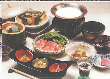
▲しゃぶしゃぶコース ¥4,250