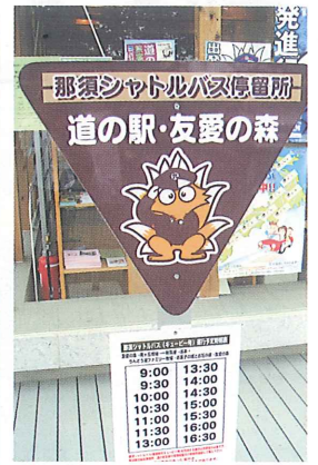
停留所もかわいいです時刻表もご参照下さい