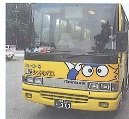
これがキュービー号です

キュービー号の折り返し地点「湯本」までお送りさせていただきます。お気軽にお申しつけ下さいませ。