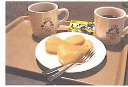
チーズガーデンではこんなサービスも