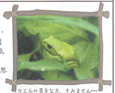
カエルの苦手な方、すみません...